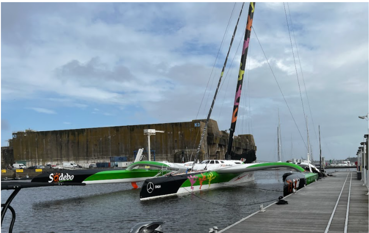
Illustrations 14-15 : Lorient