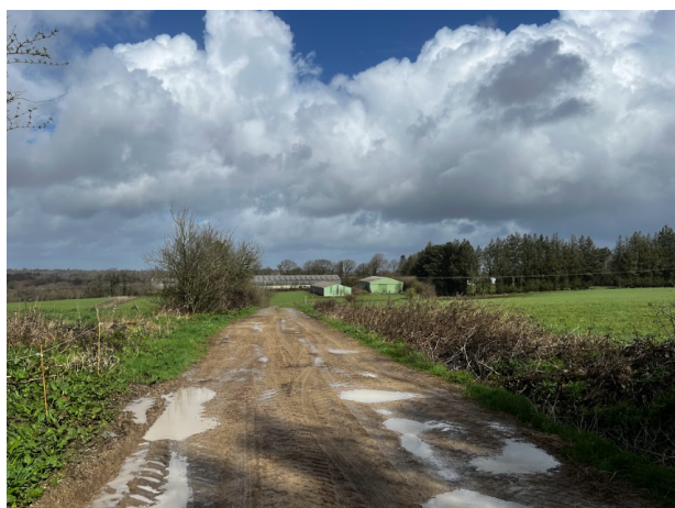
Illustrations 11-12-13 : Ferme de Céline + matériel