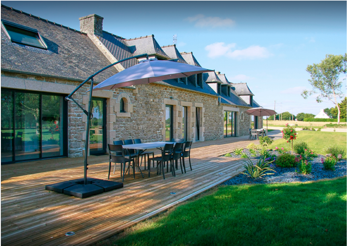
Illustration 1 : Le gîte