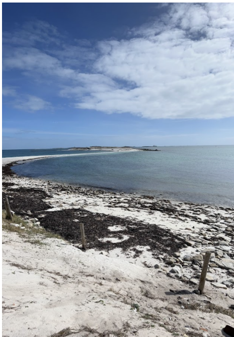
Illustration 9: Les Glénan