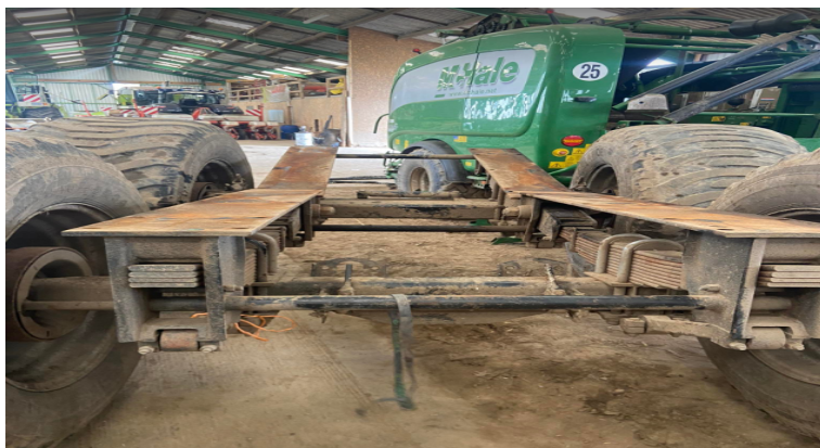
Illustration 15: Essieu fendu

Le 29 mars : on a dû démonter un essieu du tonneau, car il était fendu. Le tonneau avait déjà été retourné. On a dû le lever avec 2 manitous car il était fort lourd.