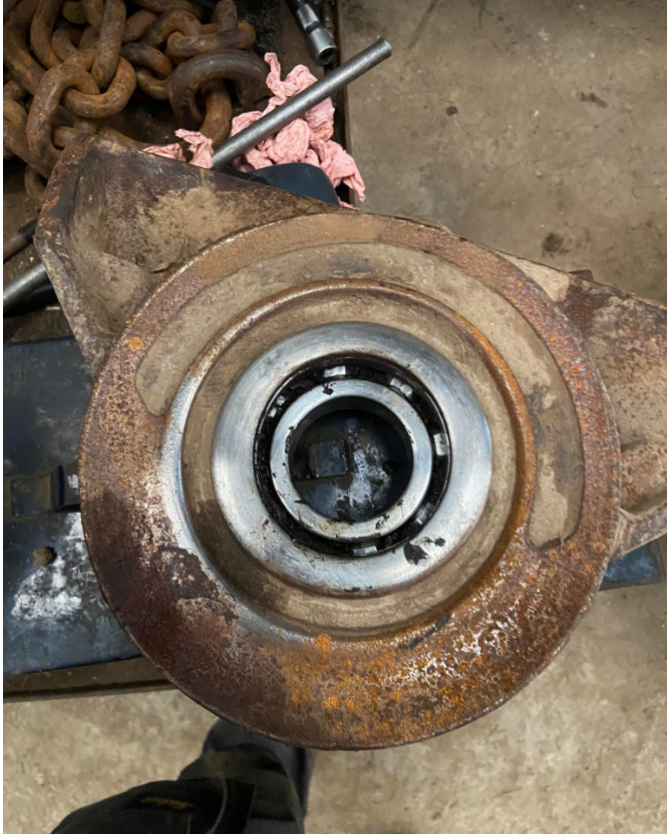
Illustration 7: Roulement

Le 23 mars 2023: Nous avons remonté le bec de l'ensileuse. Ensuite, nous avons remonté les toupies qui sont dessus pour pouvoir le ranger dans un bâtiment pour que ce soit prêt pour la prochaine saison.