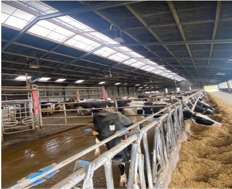
Illustration 1: Robot de traite