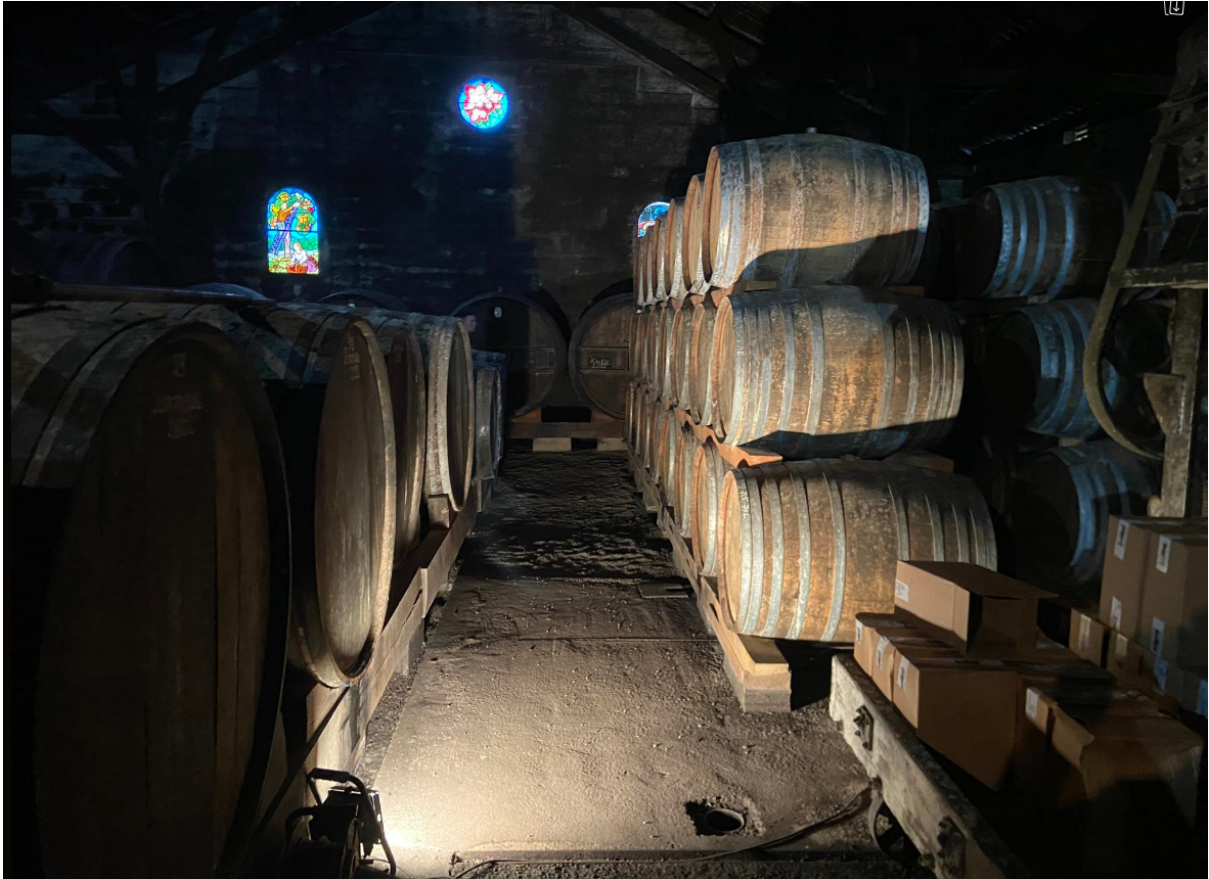
Illustration 3: cidrerie