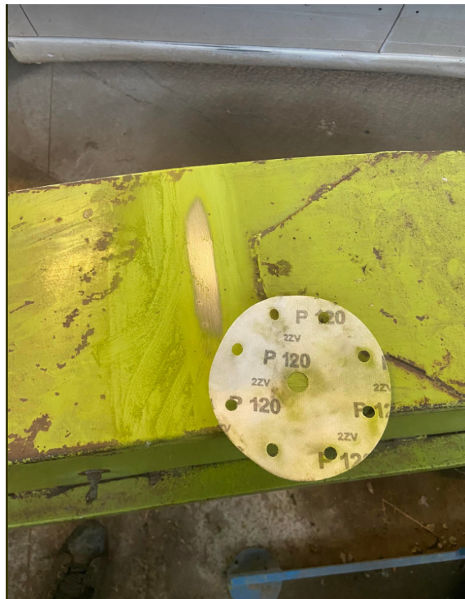
Illustration 12: poncer la buse

Le 27 mars 2023: On a poncé la buse pour que le patron la remette en couleur. Après, j' ai été chercher un semoir à maïs pour qu'il puisse le revisser.