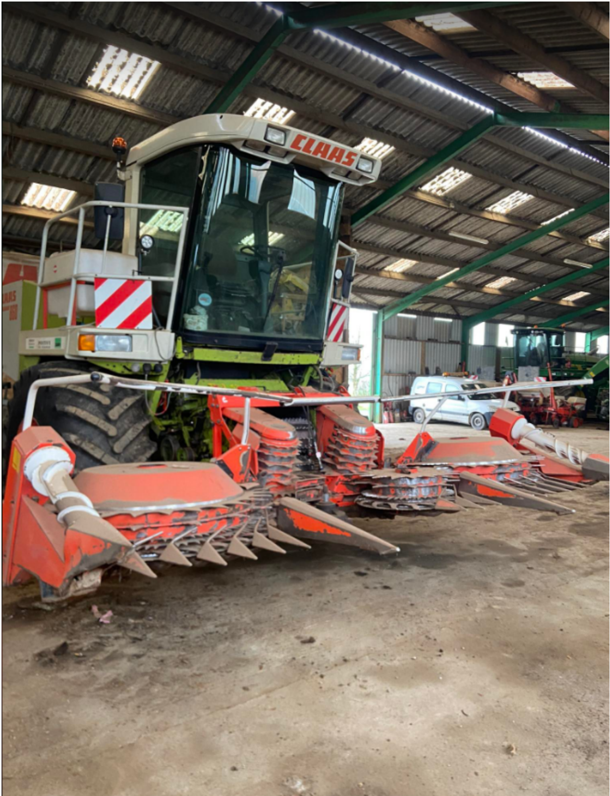
Illustration 8: Ensileuse