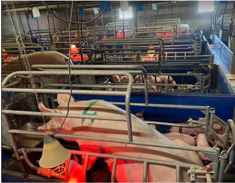
Illustration 11: Porcherie

Le 27 mars 2023: On a poncé la buse pour que le patron la remette en couleur. Après, j' ai été chercher un semoir à maïs pour qu'il puisse le revisser.