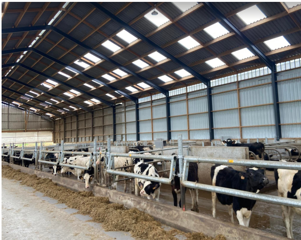
Illustration 2: vaches laitières