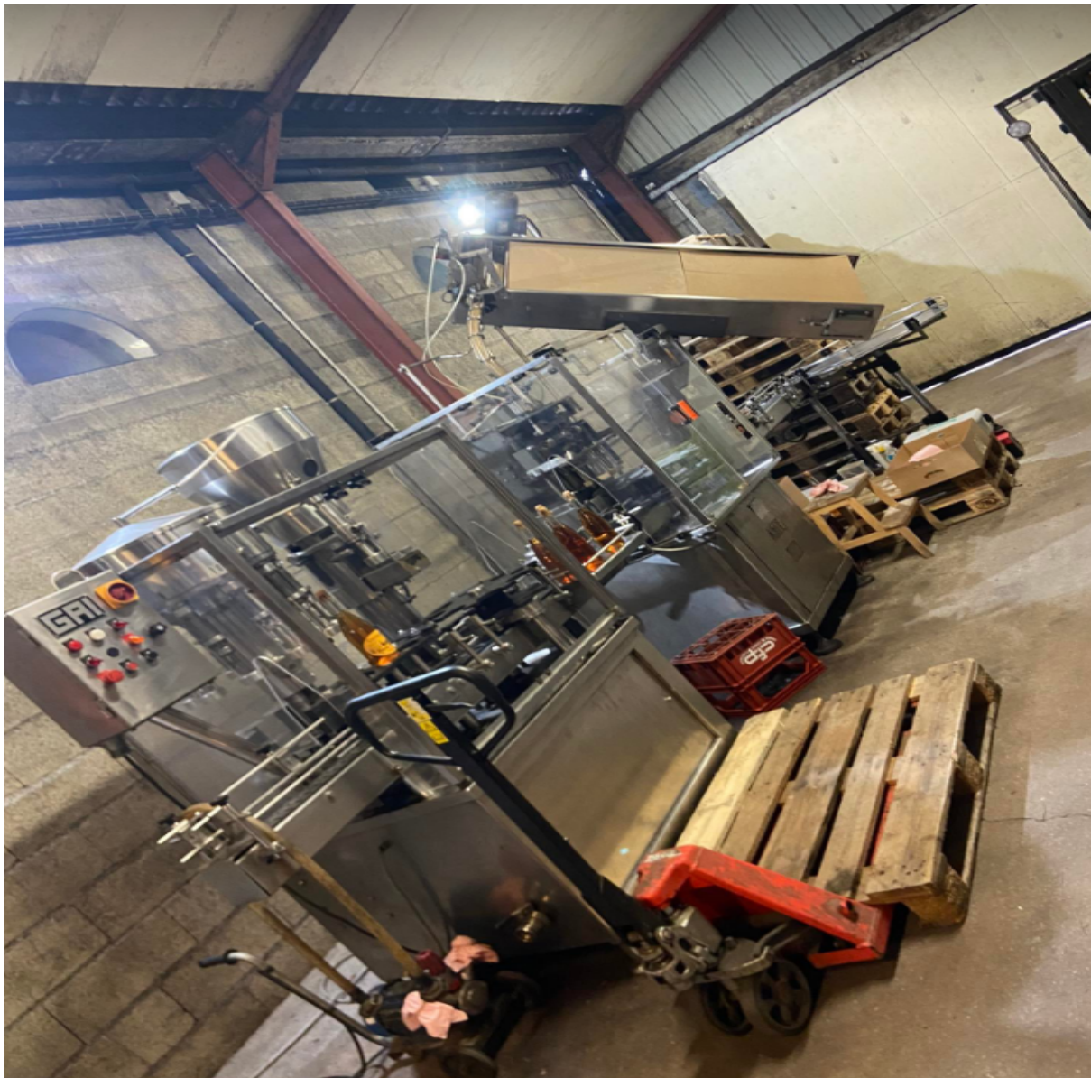
Illustration 4: Machine pour coller les étiquettes

Le 19 mars 2023: On s'est levés, puis nous avons préparé les valises car on ne revenait pas au gîte. Nous avons chargé la voiture, les profs nous ont conduits jusqu'au port où des guides nous attendaient pour partir en visite. On a pris la mer sur deux bateaux. On a eu une balade d'environ une heure durant laquelle on a eu des explications. On a aussi eu l'occasion d'observer des animaux tels que des goélands, des mouettes, des phoques. Après, on a débarqué sur une île où il n'y avait personne. Nous avons mangé nos tartines sur la plage et, ensuite, on s'est promenés sur l'île. Milieu d'après-midi, on a repris le bateau pour revenir au port. Ensuite, les professeurs nous ont conduits dans nos familles d'accueil. J'ai passé une bonne journée. En plus, il y avait du soleil et c'était une super ambiance.