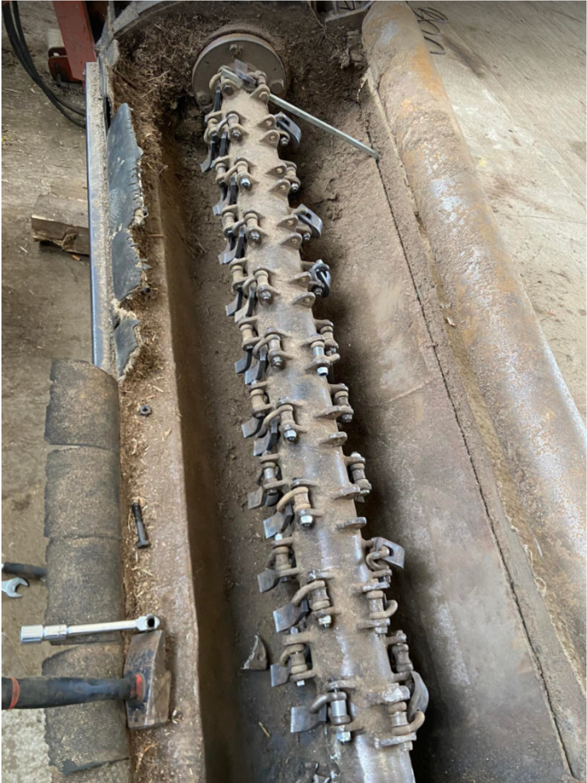
Illustration 14: Marteaux du broyeur

Le 28 mars : On a retourné le broyeur pour changer tous les marteaux. On y a passé toute la journée.