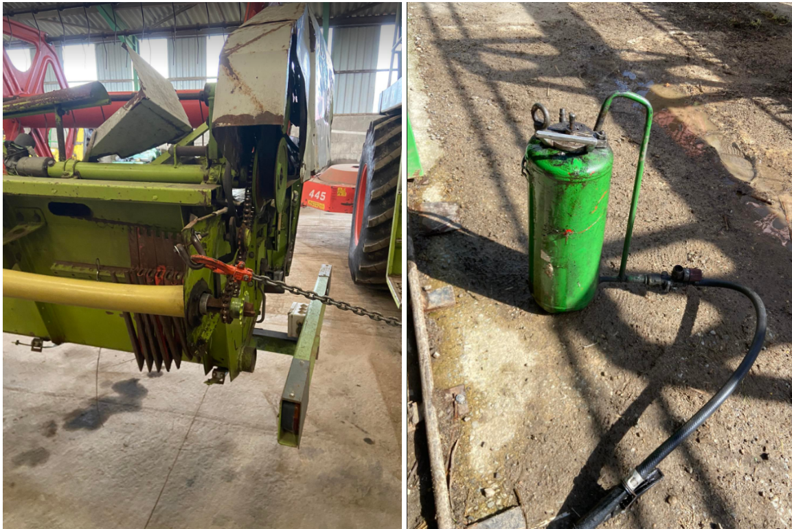
Illustrations 9 et 10: travail sur la moissonneuse

Le 24 mars 2023: Je suis arrivé à l'entreprise. On a accroché la barre de coupe de la moissonneuse, on a dû redresser des tôles qu'un étudiant avait pliées, puis on a nettoyé la machine et on l'a mazoutée pour ne pas qu'elle rouille. Les profs sont venus me rechercher au soir.