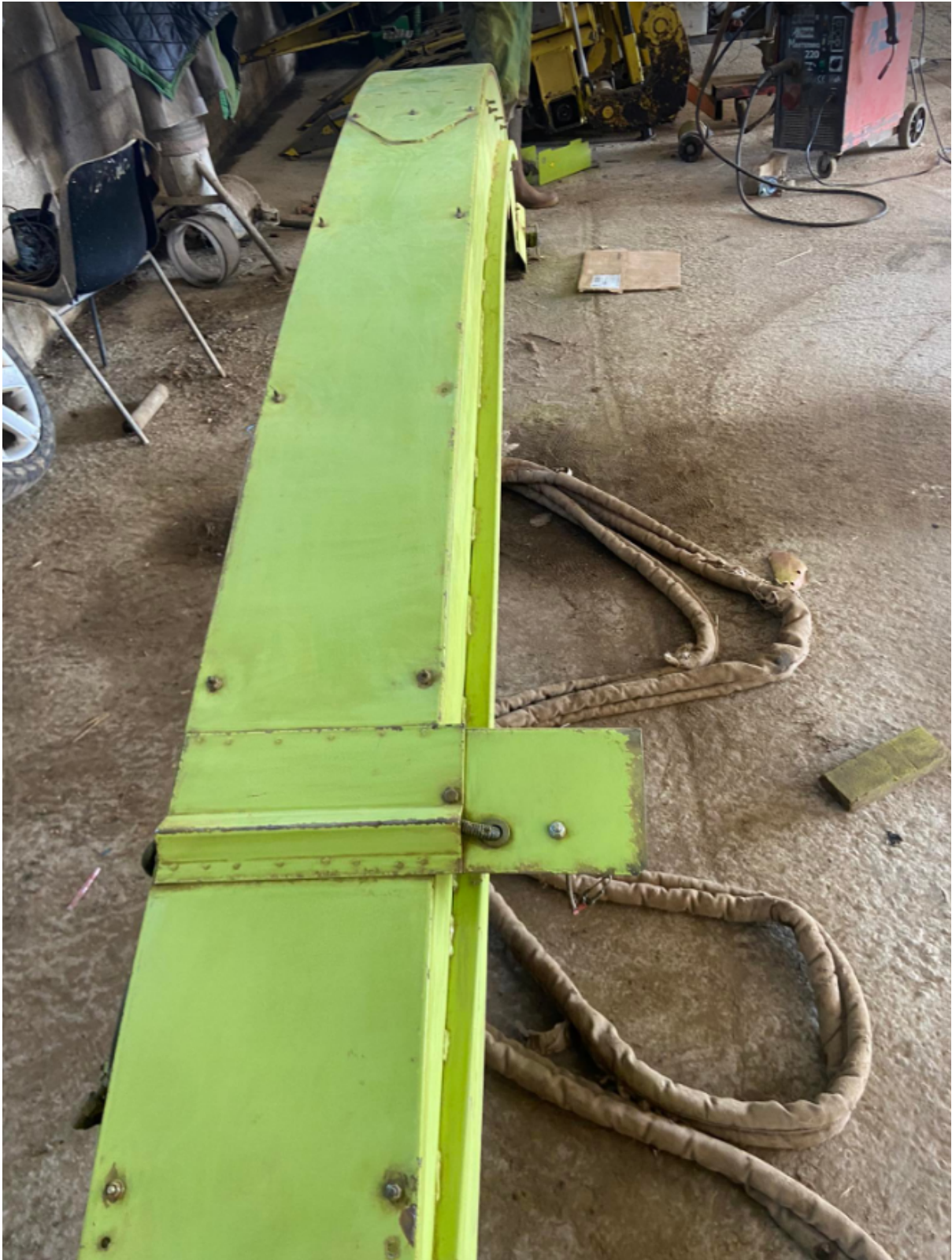
Illustration 13: Travail sur la buse