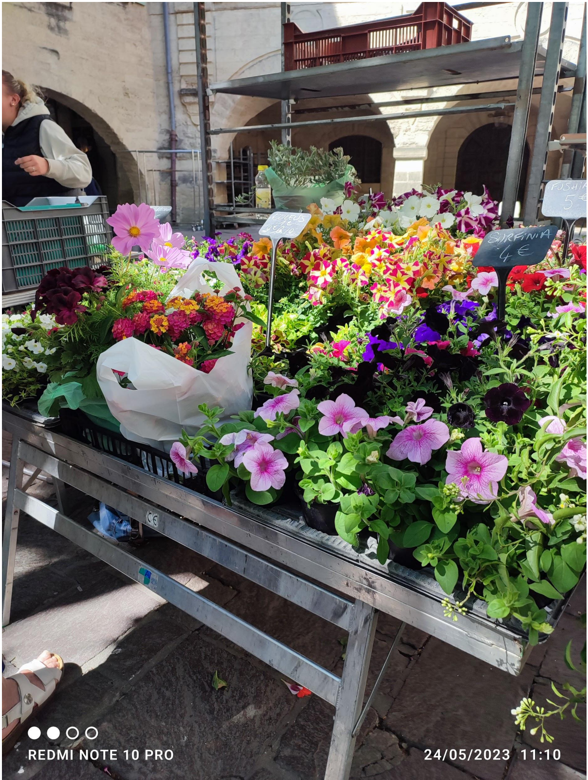
Puis on a été chercher briouc a la Gare